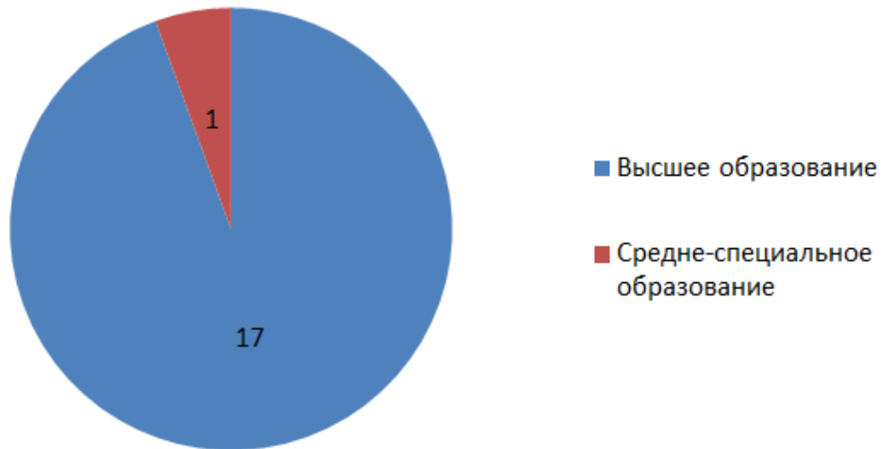
Состав педагогов КГУ "Березовская основная школа" по уровню образования

С высшим образованием -17, что составляет 94,4%, со средним специальным – 1 педагог, 5,6%.