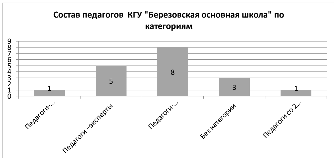
Состав педагогов КГУ "Березовская основная школа" по категориям